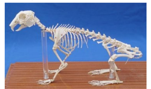
Rabbit skeleton (specimen)

El Rectorado de la UPM va a anunciar en los próximos días medidas de choque ante la posible amortización del MonteGonejo. Según informan fuentes no reveladas, se ha alcanzado un principio de acuerdo con la Fundación Dinosaurios Turolenses (DinoTur) en virtud del cual se trasladará el Campus de Shanghai a la localidad de Ariño